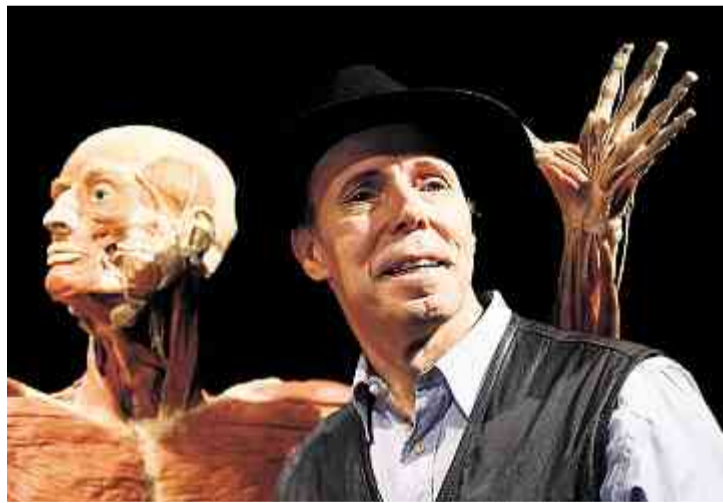
Leichenpräparator Gunther von Hagens zeigt seit dem 10. September seine Ausstellung «Körperwelten» in Zürich.