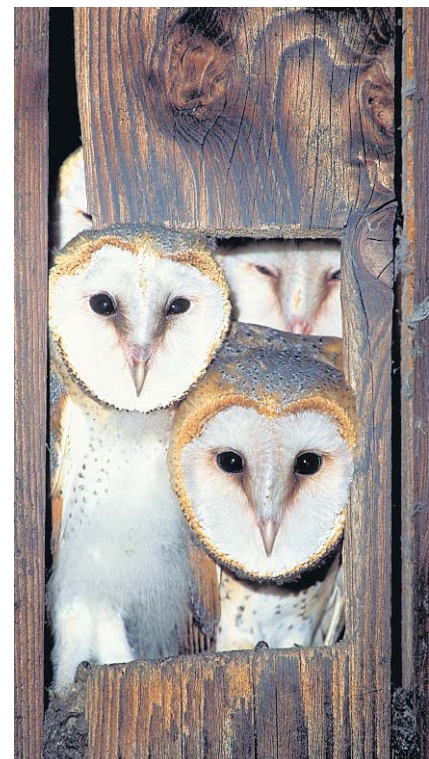
Für solche Bilder braucht es Geduld und Glück.