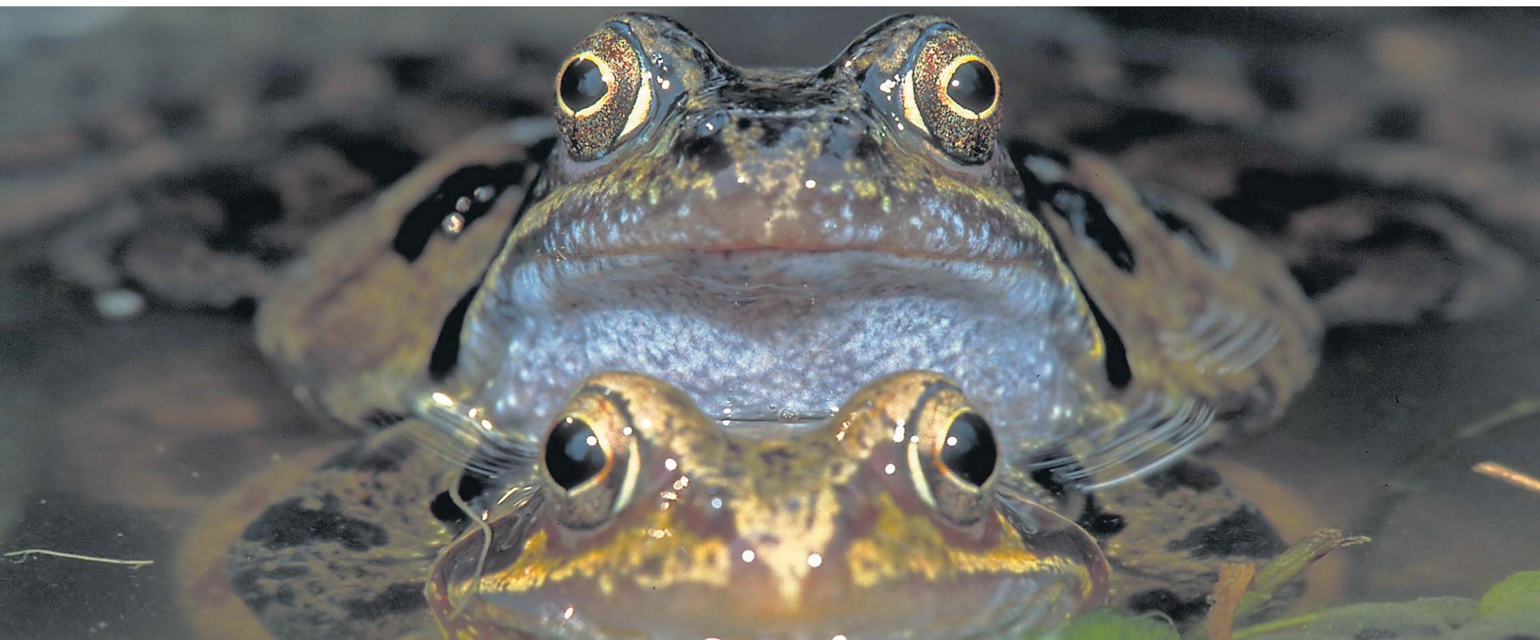
Der neue Kinofilm «Wildnis Schweiz» geht ganz nah an die einheimische Tierwelt heran und zeigt sie ganz gross – zum Beispiel die Schönheit dieser Frösche.