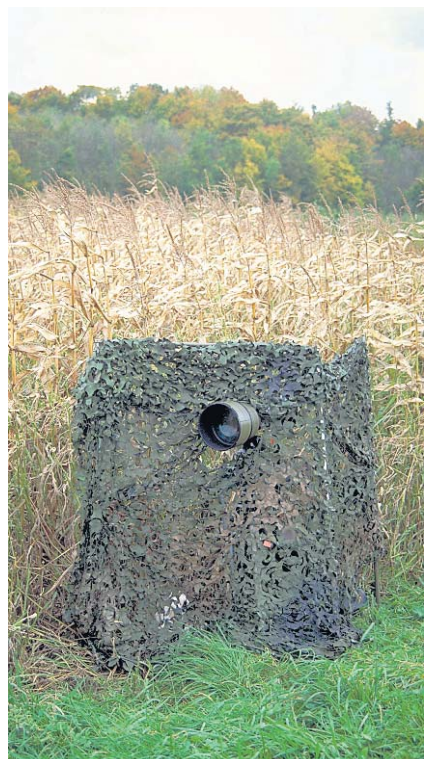
Eine gute Tarnung ist beim Filmen von Tieren wichtig.