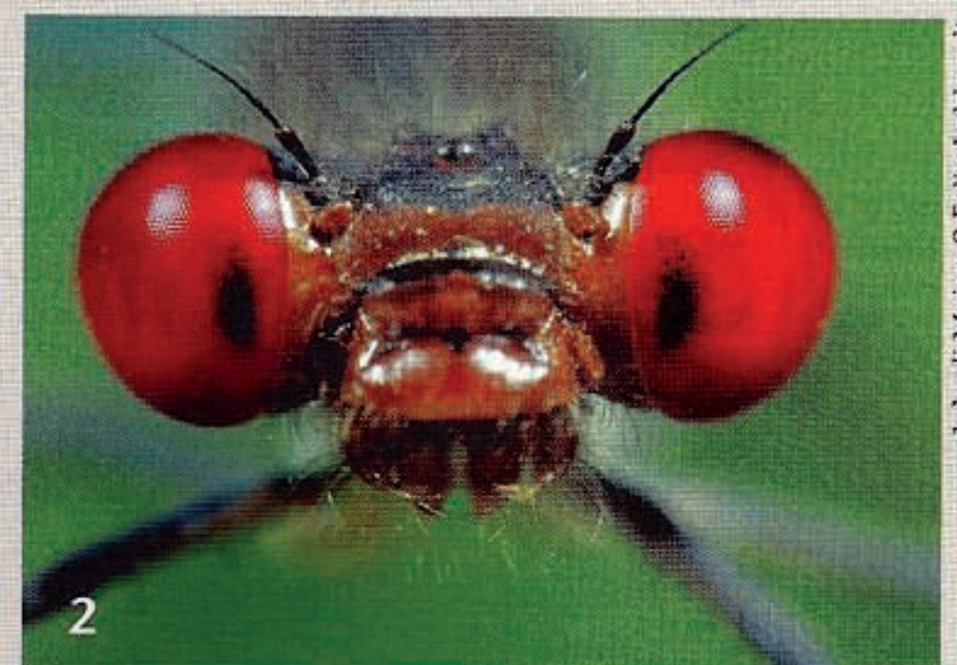
1 Sonnenaufgang im Wald. 2 Schon mal einer Libelle so tief in die Augen geschaut?