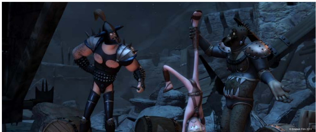
Nur durch einen glücklichen Zufall kann Ronal Volcazars äußerst untergebenen Handlangern entkommen.