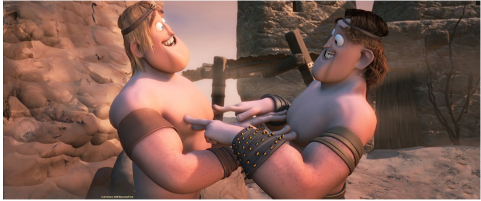
Die Freude am Kampf ist groß.