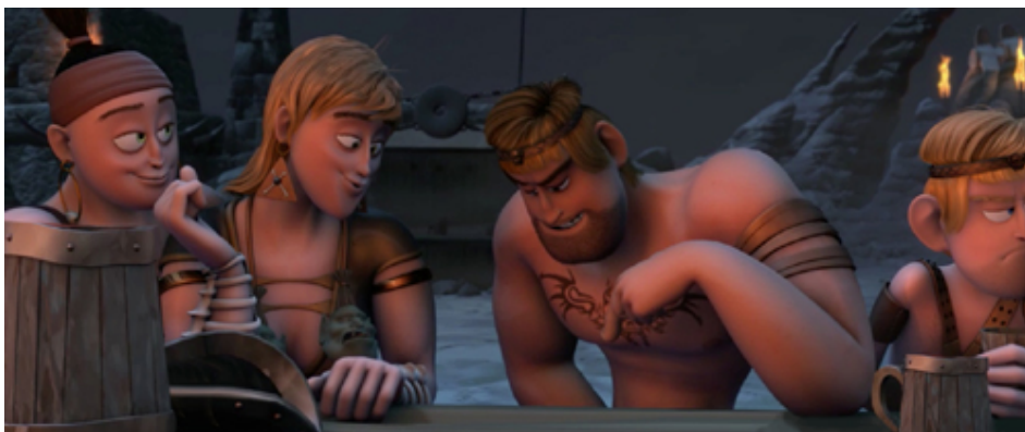
Am Vorabend des Feldzugs feiern die Barbaren ein Fest. Krieger Gorak möchte seine sexy Mitstreiterinnen durch besondere Manneskraft beeindrucken...