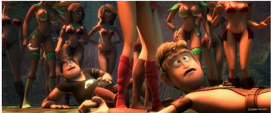
Alibert und Ronal fallen in die Hände der Amazonen. Nun ja, es könnte schlimmer sein ...