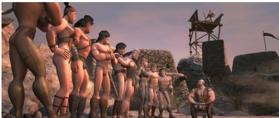
Jedes Jahr begibt sich der durchtrainierte, vor Kraft strotzende Barbarenstamm auf einen Feldzug.